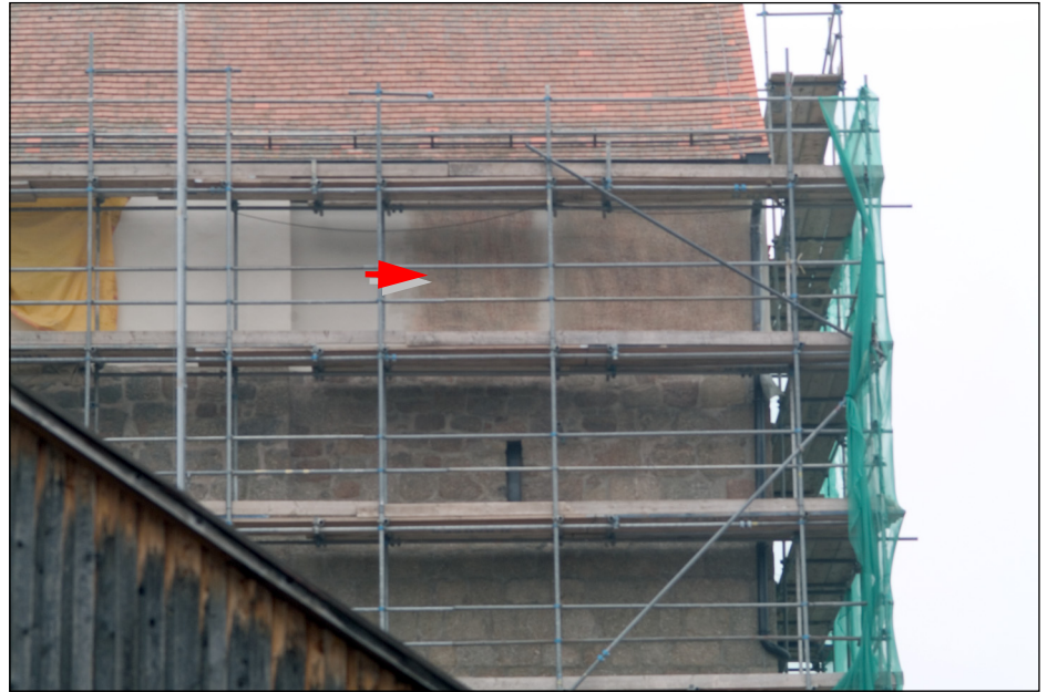
ABBILDUNG 3. Südfassade, Ostecke: Farbmuster für die Gestaltung des oberen Putzbandes, hier ungefähr in Bildmitte (siehe Pfeil)

Ziel für die neu auszuführende Farbgestaltung des Bandes ist die ästhetische Integration der Putzflächen in den Gesamtbestand des Fassaden - das Band soll möglichst wenig „auffallen“. Nach mehreren Versuchen erwies sich eine strukturierte Spritztechnik als optimale Lösung 9 .