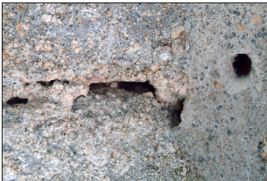
ABBILDUNG 2. Westfassade; Stelle mit fehlendem Verputz in der Fuge und einer Fugenkittung von 1972, das Bohrloch darin entstammt dem - nicht geglückten - Versuch des Gerüstbauers an dieser Stelle das Gerüst an der Fassade zu verankern

Die Situation erklärt sich dadurch, daß die Quader ursprünglich nur auf Mörtelportionen versetzt wurden und der Turm anschließend insgesamt verputzt worden war - ein gezieltes Schließen von Fugentiefen also nicht erfolgte. In zeichnerischen Darstellungen der Burg ist ein Verputz bis in den Beginn des 20. Jahrhunderts nachweisbar.