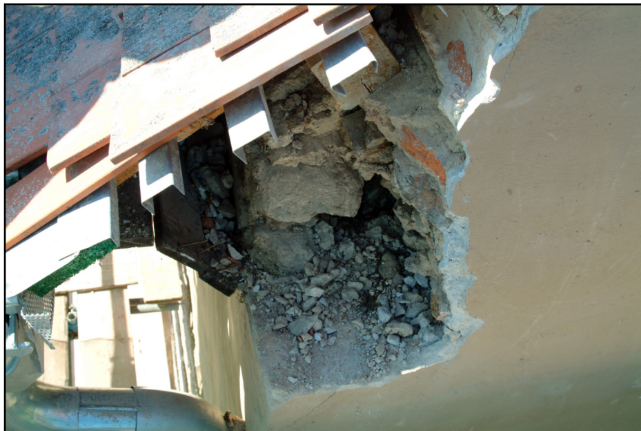
ABBILDUNG 1. Ostgiebel, südliche Traufe; Sanierung der Lattenenden mittels Anschuhung (Aluminiumprofile) und Sanierung von geschädigtem Mauerwerk

Auf grund der exponierten Lage des Turmes wurde - auch erstmalig - am Turm eine Blitzschutzanlage angebracht.