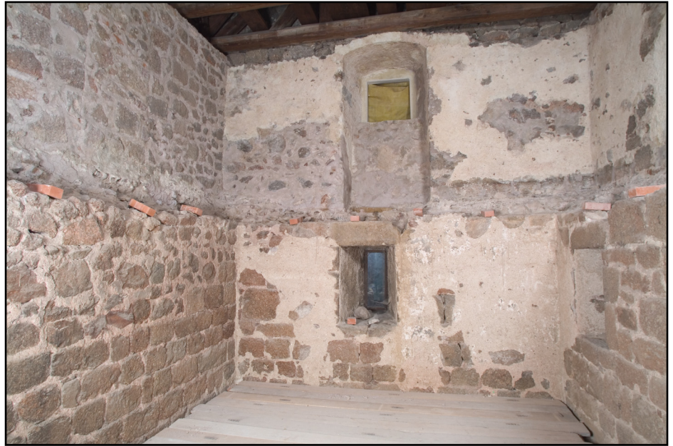
ABBILDUNG 4. Oberer großer Raum, Ebenen 1 und 2, Blick Richtung West: oberes Fenster neu geöffnet, mit historischem Sturz; ausgeführte Putz- und Fugensanierung; or Einbau der Galerie