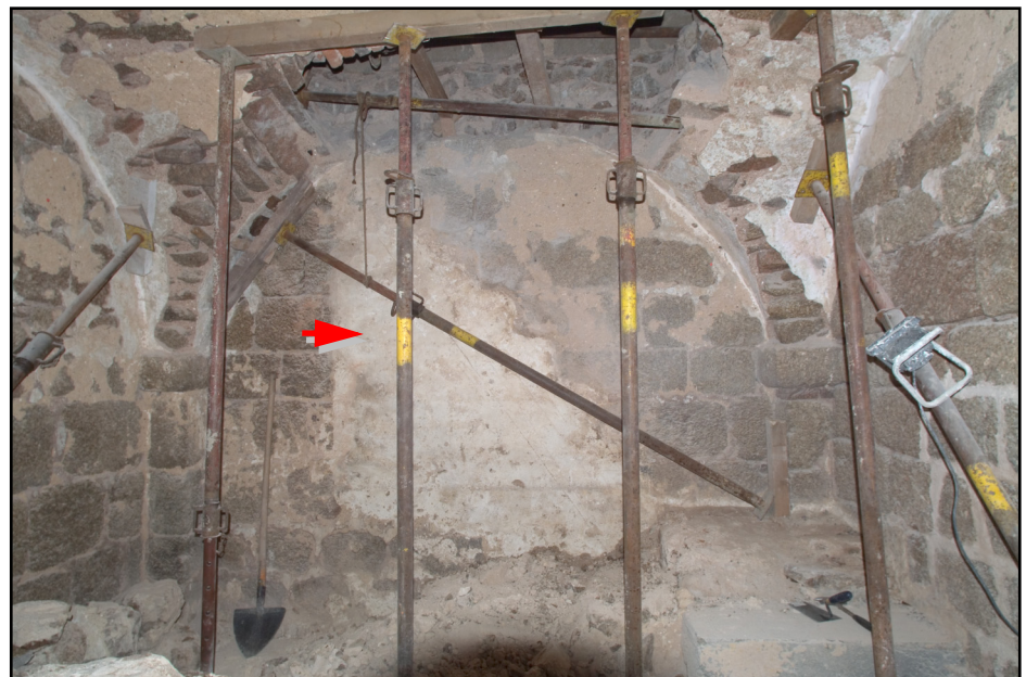
ABBILDUNG 5. Kapellenraum, Ebene 0, Westwand unterhalb der Empore mit rückgebautem Treppenblock, Putzfragment (siehe Pfeil) und aufgestemmter Treppenlauf-Öffnung

Nach Rückbau des barocken Treppenblockes - der laut Plan einer neu eingestellten, wenig „auffälligen“ und als nicht historisch erkennbaren Treppe von der unteren Ebene auf die Empore weichen soll - wurde hinter dem Treppenblock auf der Westwand Fragmente eines älteren, vermutlich ursprünglichen Verputzes des Granitquader-Mauerwerkes sichtbar (vgl. Abb. 5). Die Fragmente bleiben erhalten und hinter der neuen Treppe sichtbar.