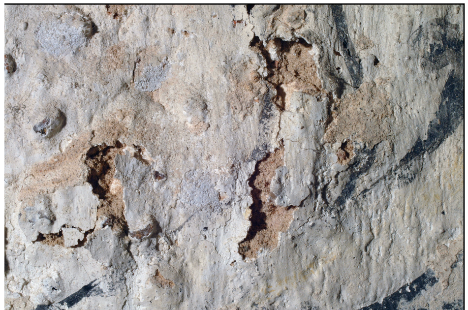
ABBILDUNG 7. Chorraum, Südwand: Bereich mit folieartig aufliegender und akut geschädigter Malschicht - das Schadensbild erforderte konservatorische Sofortmaßnahmen

Der aktuelle Erhaltungszustand der Malschicht erforderte unverzüglich ausgeführte Notsicherungen.